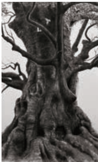
現水展大賞 「神宿る樹 / 蒲生の大楠」 内山 茂